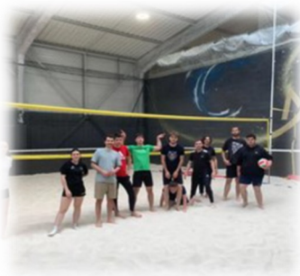
Beach volley au Lycée Horticole de St Ismier

Qu'est ce que la SOP ? Organisée chaque année depuis 2017, la Semaine Olympique et Paralympique a pour but de promouvoir la pratique sportive chez les jeunes autour de valeurs citoyennes.