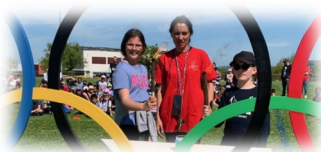
École élémentaire les Marronniers St Quentin Fallavier