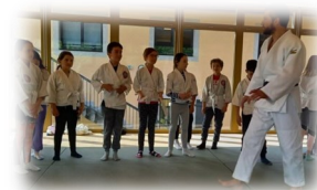
La Muraz (74) - initiation judo

Qu'est ce que la SOP ? Organisée chaque année depuis 2017, la Semaine Olympique et Paralympique a pour but de promouvoir la pratique sportive chez les jeunes autour de valeurs citoyennes.