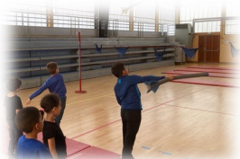
Ecole primaire de Fontaine : initiation javelot

L'aventure Olympique et Paralympique continue, embarquez dans cette nouvelle édition de la Semaine Olympique et Paralympique 2025 et faites de cette semaine un moment extraordinaire où le sport est source de joie, d'apprentissage et de cohésion !