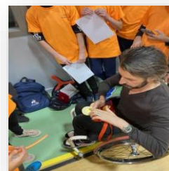
Collège Mariotte – St Siméon de Bressieux