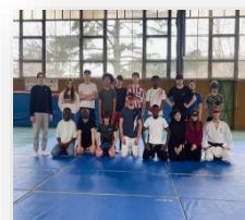
Lycée Dauphiné – Romans sur Isère