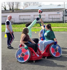
Lycée Pravaz – Pont de Beauvoisin