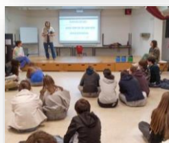
« Festival Montagne engagé » - Collège de Groisy