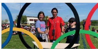
Ecole Les Marronniers St Quentin Fallavier