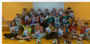
Lycée Champollion - Grenoble